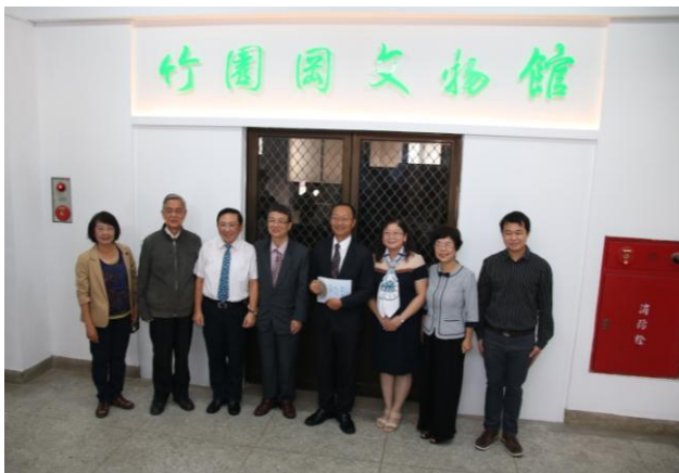
▲ 竹園岡文物館 揭幕

文物館作為支援人文社會學科的教學資源中心，平時除提供各學科教學上的需要，開放師生參觀外，亦積極規劃定時對外開放，希望能發揮它最大的教育功能。