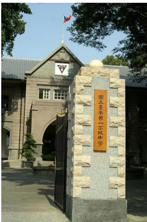
▲ 國立臺南第一高級中學 校門

全校 3 個年級，合計 57 個班級，包含普通班、資優班(含數理及語文)及科學班。