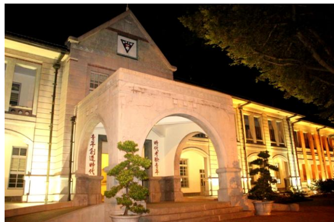
▲ 國立臺南第一高級中學 紅樓

校園北側地處凹處，是古溪流德慶溪的起點；北側有舊城牆通過，城牆現雖然已經拆毀，但仍保留長度約 50 公尺的城基，仍能看出當時築城的技法與材料。校園內有市定古蹟「原臺南州立第二中學校校舍本館暨講堂」以及州立二中時期興建的禮堂。