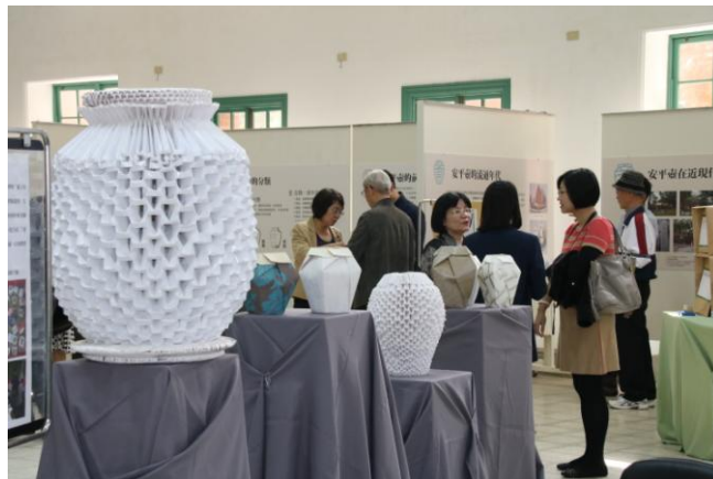
▲ 「壺光歲月」 安平壺的前世今生展覽