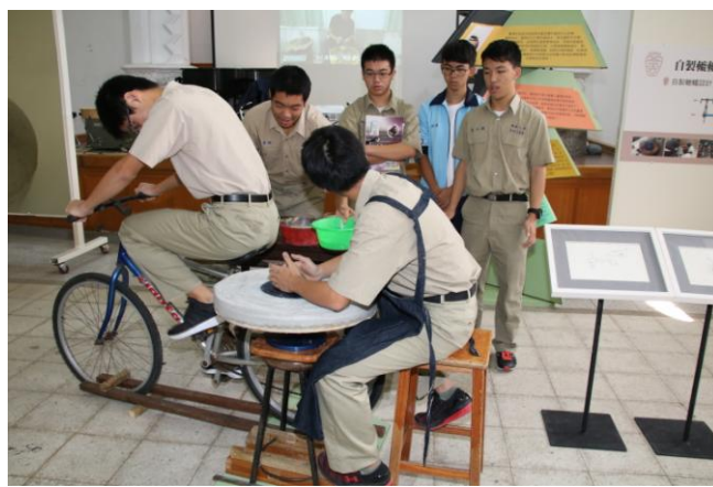
▲ 學生體驗使用人工方式製作陶製品

學校教育的可貴，在於生命素質的彰顯，因此，我們把學生學習的精進卓越建基在生命長大的磐石上。竹園岡教育工作者，堅持教育初衷、樂在工作，生命有盼望，喜樂滿懷。竹園岡教育工作者，一顆心，愉悅；一個器皿，沒有己，只盛裝教育愛、專業能力與生命情懷。