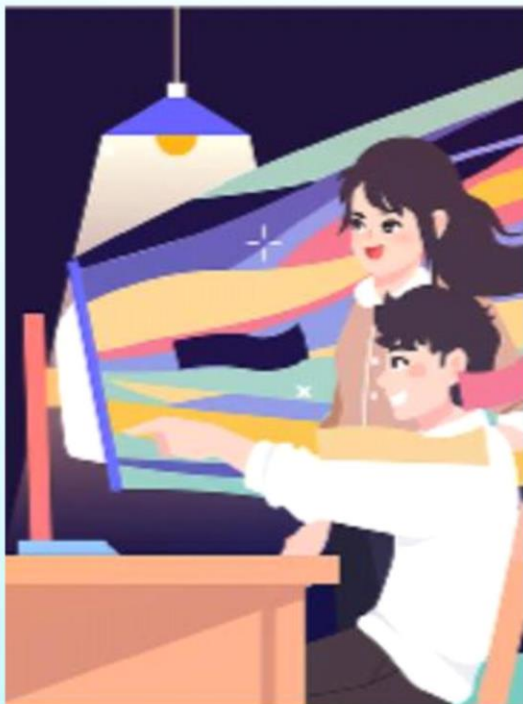
第一單元 媒體識讀