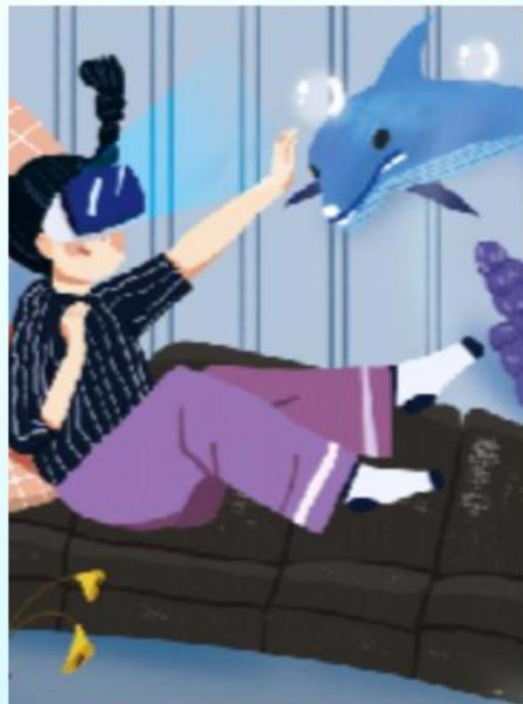
第三單元 重要的新興科技