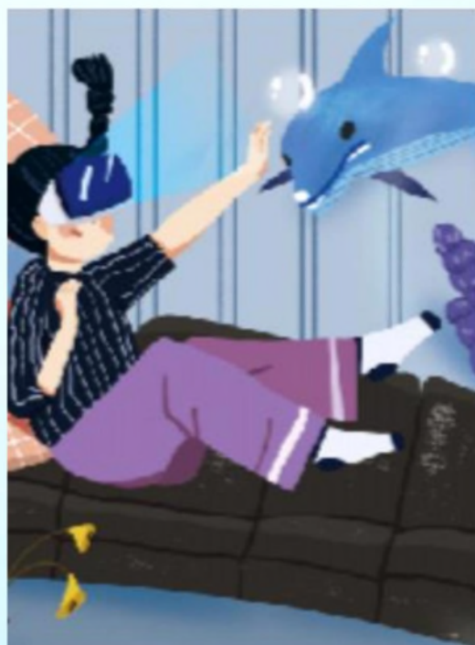
第三單元 重要的新興科技